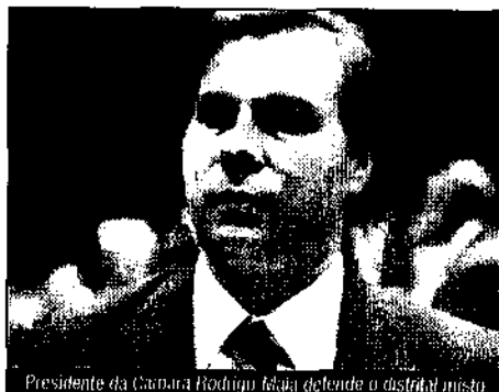
Presidente da Câmara Rodrigo Maia defende o distrital misto

Maia participou nesta segunda-feira (21) em São Paulo de um fórum promovido pelo jornal 'O Estado de S. Paulo'. O presidente da Câmara destacou que "fazer texto de reforma política é muito difícil