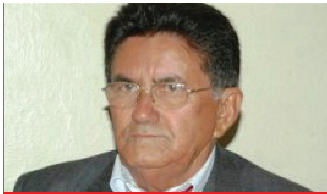
EX-PREFEITO MUNICIPAL DE RAPOSA, ONACY VIEIRA CARNEIRO

Na análise da questão, a juíza constatou que o Município de Raposa celebrou o convênio com o objetivo de preservação e dinamização do São João Maranhense, envolvendo na programação atividades como arraiais, festivais de comidas típicas, apresentações artísticas e manifestações 20/02/2019