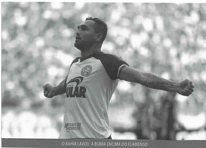
O BAHIA LAVOU A BURRA ENCIMA DO FLAMENGO

A verdade é que nada funcionou na atuação do Flamengo em Salvador. Nem individualmente, nem coletivamente. É difícil apontar um jogador que na apresentação o que dele se espera em condições normais, e isso naturalmente con-