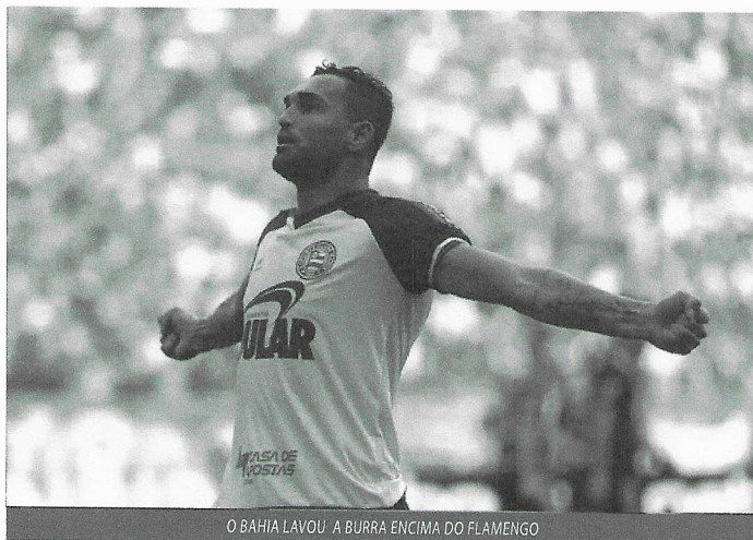
O BAHIA LAVOU A BURRA ENCIMA DO FLAMENGO

A verdade é que nada funcionou na atuação do Flamengo em Salvador. Nem individualmente, nem coletivamente. É difícil apontar um jogador que na apresentação o que dele se espera em condições normais, e isso naturalmente con-