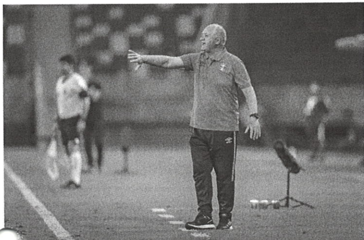
Felipão em ação pelo Grêmio na vitória contra o Cuiabá pelo Brasileiro